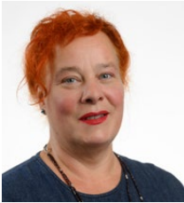
Heike Gauss Information und Beratung

Dienstag bis Donnerstag 7.00–16.00 Uhr Tel. +41 52 634 38 38 heike.gauss@spitaeler-sh.ch